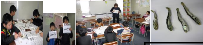
春期講習会 理科実験教室の 様子をパチリ