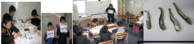
春期講習会 理科実験教室の 様子をパチリ